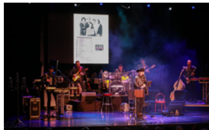
Bilder från förr bjöds det friskt på.