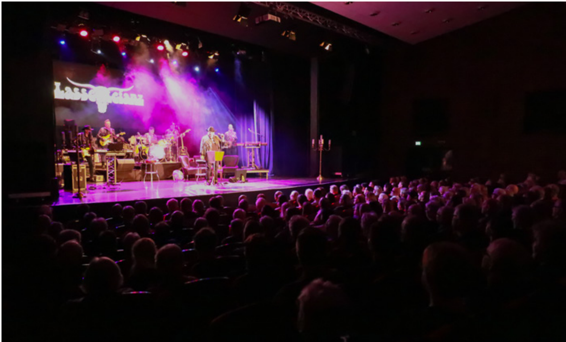
Det var fullsatt på Östraboteatern i Uddevalla under fredagskvällen och konserten hade sålt slut redan vid jul. Det enda som saknades var möjligheten att bjuda upp till dans.